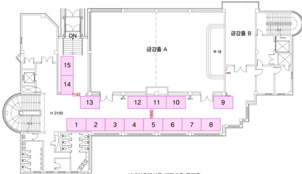
더케이호텔서울 별관 2층 금강홀